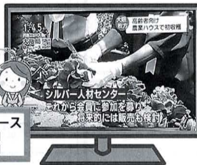
テレビ放送 されました