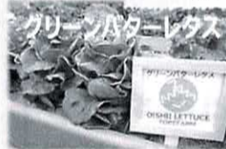
グリーンバターレタス