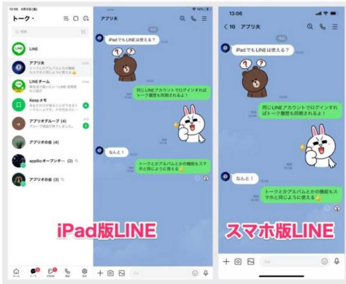
同一アカウントでLINEにログインしているスマホとiPad。iPadに「ウォレット」タブは表示されない

iPhoneやAndroidスマホですでにLINEを利用しているも、同じLINEアカウントでiPadのLINEにも同時ログインが可能。